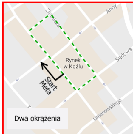
Trasa biegu dla szkół gimnazjalnych – 850m (2 pętle)